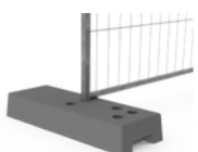
plot béton 36 kg